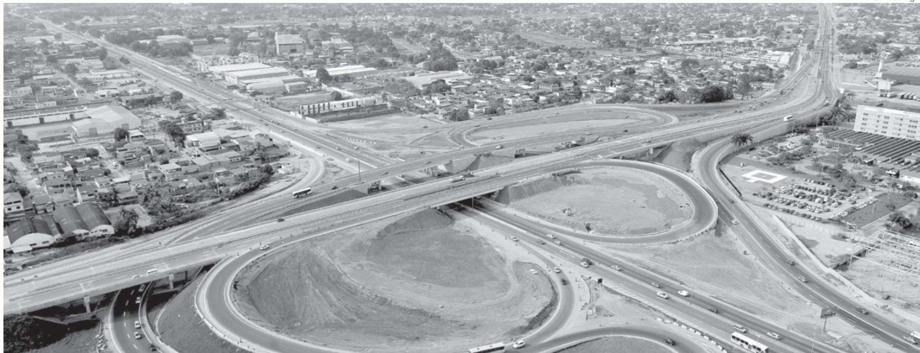
Arco irá receber nova iluminação e a instalação de 120 câmeras

- Hoje, eu e o prefeito de Duque de Caxias, Washington Reis, tratamos sobre diversas pautas importantes para o desenvolvimento econômico fluminense. Uma das principais é o investimento na iluminação de todo o Arco Metropolitano. A Prefeitura de Caxias vai instalar todas as câmeras para que possamos realizar o monitoramento da rodovia. É uma grande parceria. No início deste mês, assinamos também com a