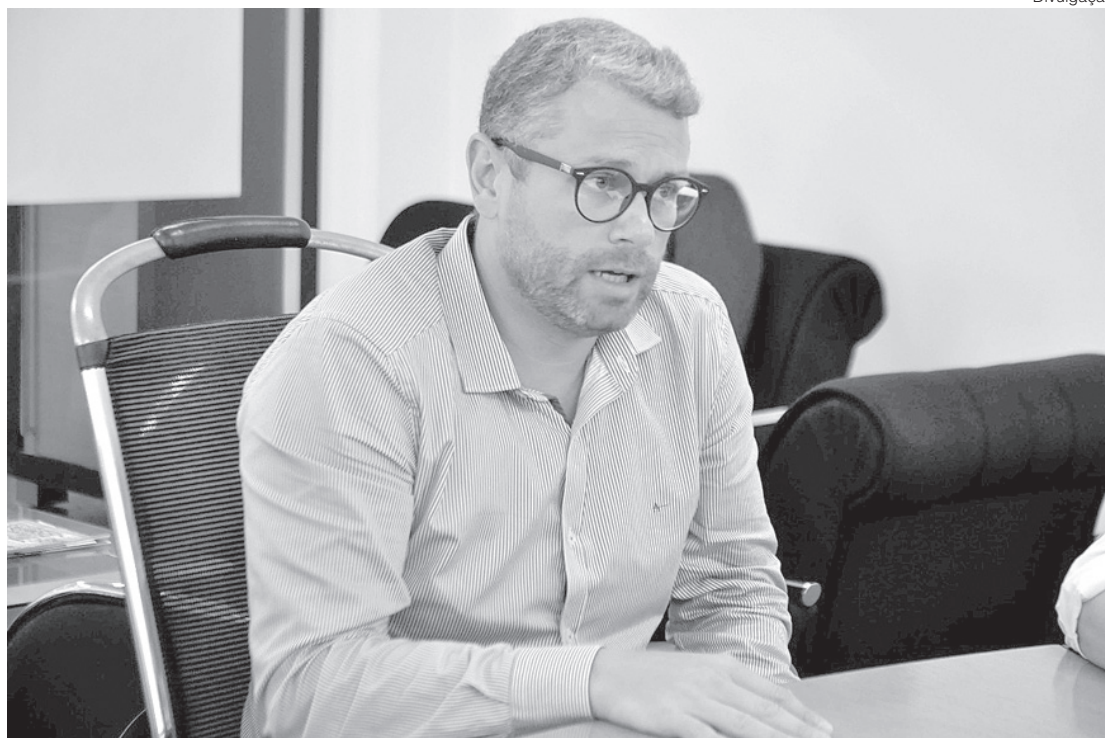
Prefeito fala de novas medidas restritivas

atividades laborais, todos os servidores públicos municipais, maiores de 60 anos ainda não vacinados. Já as academias e estabelecimentos de prática de atividades físicas funcionarão com até 50% da capacidade de ocupação, distanciamento de 1,5 metro entre os usuários e agendamento prévio, que deverá ser apresentado a fiscalização quando exigido, ficando o estabelecimento infrator sujeito a suspensão de seu alvará de