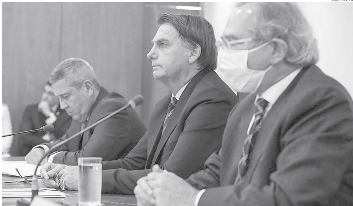
A decisão foi tomada em reunião que teve a participação do presidente Jair Bolsonaro e do ministro da Economia, Paulo Guedes.

A venda dos Correios depende de aprovação pelo Congresso do projeto de lei que regulamenta a abertura do mercado postal à iniciativa privada. O Ministério das Comunicações apresentou uma lista de etapas, mas sem especificar datas. Segundo o itinerário, estão previstos debates com a sociedade e com investidores, debates com empregados e