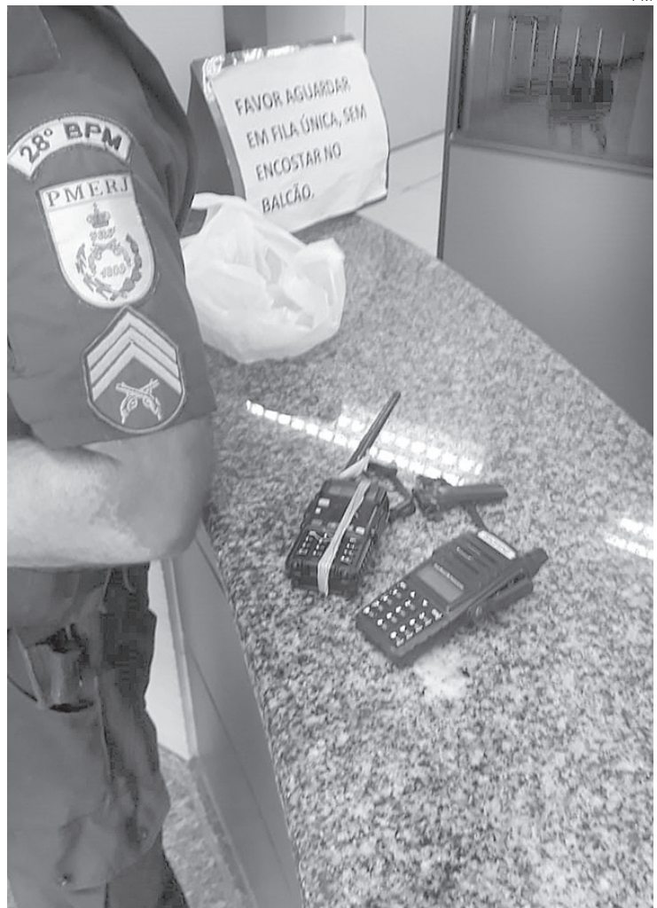
Rádios utilizados entre traficantes para se comunicarem ficaram apreendidos