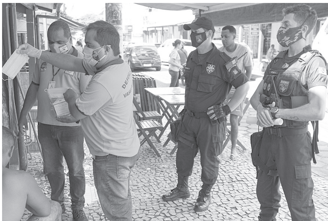
Funcionários da Prefeitura de Vassouras durante ação de fiscalização