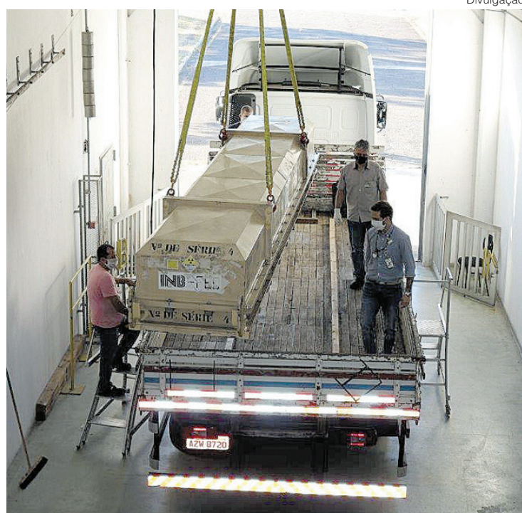
Produção, que foi concluída em dezembro de 2020, seguiu diversos protocolos de controle e prevenção da covid-19 para dar continuidade às atividades

A recarga é o processo de reabastecimento de uma usina nuclear por meio da substituição de elementos combustíveis já utilizados por novos, que