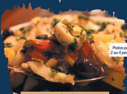
BACALHAU À LÁ RICARDO