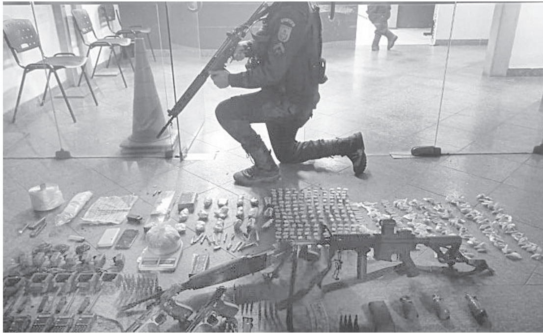
Fuzis, pistolas, munições, rádios transmissores e drogas foram apreendidas

Três jovens, de 20, 19 e 18 anos, morreram na segunda-feira, dia 15, suspeitos de participarem de uma troca de tiros com a PM em Itatiaia. O confronto aconteceu em área de mata, no Vale do Ermitão, em Penedo. Outro suspeito, de 27 anos, conseguiu fugir. Durante a ação, dois jovens, de 17 e 14 anos, foram apreendidos. Um dos suspeitos, de 20 anos, chegou a ser socorrido e encaminhado ao Hospital de Itatiaia, mas não resistiu. Além dos suspeitos detidos, a PM conseguiu apreender farto material bélico e entorpecentes. O caso foi registrado na 99ª DP.