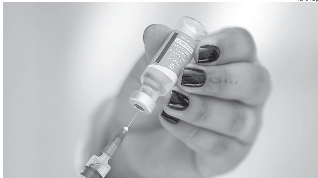
Alguns países europeus suspenderam a utilização do imunizante